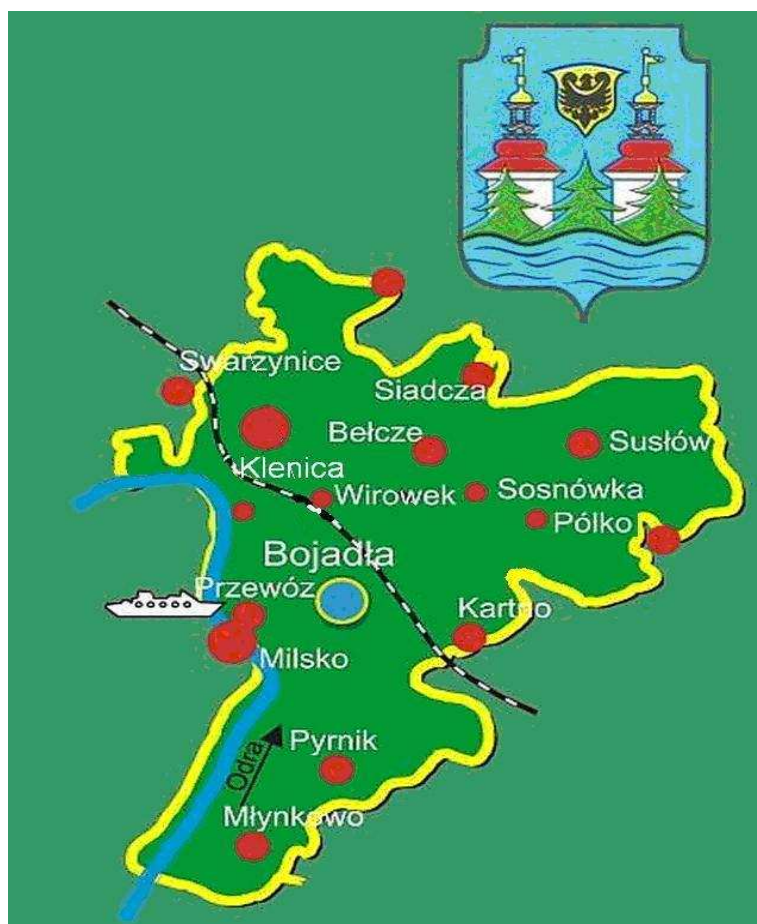
Mapa Gminy Bojadła